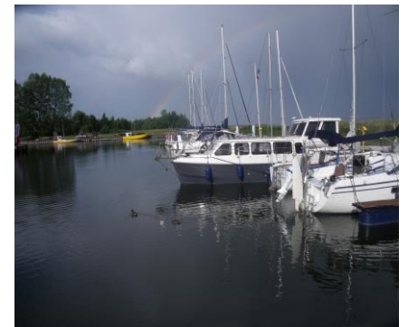
Port w Kątach Rybackich

W dniach 10-12 maja 2019 zapraszamy do naszej przystani w Rybinie, gdzie w ramach Dni Funduszy Europejskich zapraszamy na darmowe wycieczki hauseboatem po Szkarpawie. Więcej informacji pod tel. 512086077