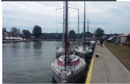
Tolkmicko - port

odczytać na naszej stronie www.petlazulawska.com .