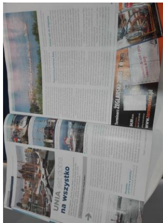
Zdjęcie artykułu z czasopisma Żagle

W artykule pt. Unia jest dobra na wszystko autorzy szeroko, na dwóch stronach, opisują założenia projektu South Coast Baltic. Bardziej szczegółowo autorzy opisują część litewską i kaliningradzką projektu.