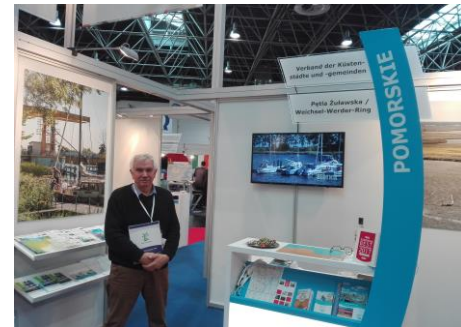
Na stoisku w Dusseldorfie Targi BOOT 2018

Ukazało się nowe wydanie przewodnika po portach i przystaniach Południowego Bałtyku (około 180 portów i przystani wraz z marinami pierwszy numer czasopisma projektu pn. South Coast Baltic z wywiadami i opisaniem szczególnie interesujących miejsc naszego regionu.