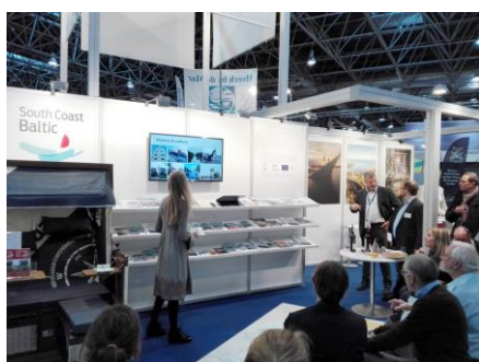
Część ogólna stoiska South Coast Baltic na targach BOOT

sobą stoisk regionów południowego Bałtyku: Kłajpedy (Litwa), Pomorza, Zachodnio-pomorskiego, Przed-pomorza (Niemcy) i Bornholmu. Dziennie każdy z regionów obsługiwał około 100 klientów dziennie, przeprowadzając z nimi pogłębione rozmowy, przekazując materiały promocyjne i gadzety. Na stoisku pomorskim pokazywaliśmy przede wszystkim Pętlę Żuławską, ale także inne atrakcje regionu.