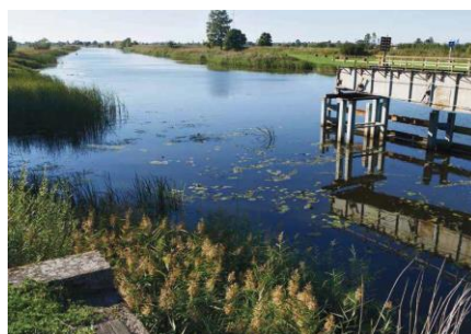
Okładka magazynu Wandel Magazine (most kolejowy w Rybinie)

Wizyta holenderskich dziennikarzy na Pętli Żuławskiej – kolejna publikacja