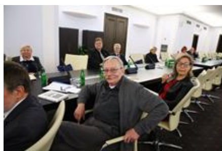
Spotkanie w Senacie RP