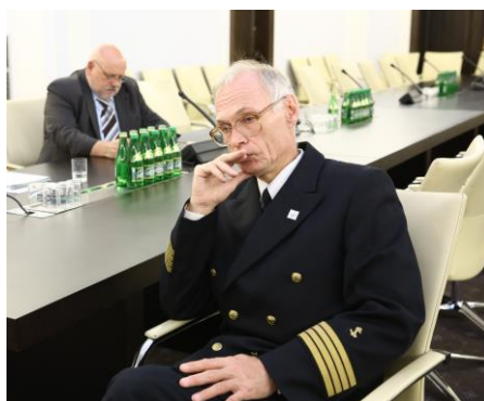
Eksperti na spotkaniu w Senacie RP

godz.12.00 w budynku Senatu odbyło się inauguracyjne posiedzenie Zespołu.