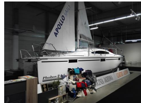
Pawilon z nową ofertą jachtową

Razem z przedstawicielami Województwa Pomorskiego uczestniczyliśmy – z sukcesem – w kolejnej już imprezie targowej WORLD TRAVEL SHOW (20 – 22 października 2017 r.) w Nadarzynie k. Warszawy. Stoisko pomorskie w tym roku było nadzwyczaj okazałe, składało się z trzech elementów promocji województwa: szlaki kajakowe, szlaki rowerowe i Pętli Żuławskiej. Ta trzydniowa impreza przyciągnęła pokaźną liczbę odwiedzających z całego regionu. Prezes Spółki osobiście i bez zadyszki obsługiwał wszystkich gości naszego stoiska.