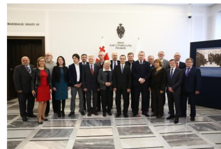
Fotografia „rodzinna” Zespołu Parlamentarnego

wnioskował o planowanie inwestycji zorientowanych na turystykę równoległe z inwestycjami przemysłowymi, a nie „przy okazji”.