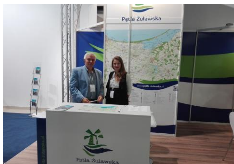
Na stoisku w Nadarzynie

Po berlińskim i bornholmskim spotkaniu przystąpiono do wydania przewodnika po portach i przystaniach Południowego Bałtyku wraz z marinami Pętli Żuławskiej (dostarczyliśmy nasze materiały promocyjne). Także lada dzień ukaże się pierwszy numer czasopisma projektu pn. South Coast Baltic z wywiadami i opisaniem szczególnie interesujących miejsc naszego regionu.