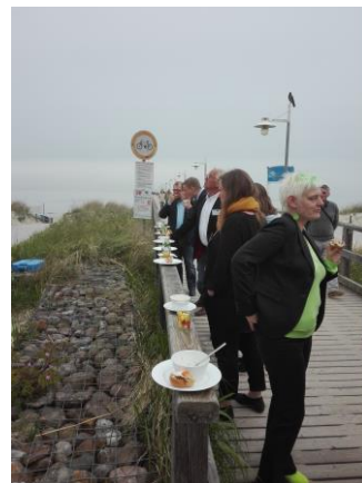
Przerwa w zajęciach na wyspie Uznam.

Tegoroczne robocze spotkanie międzynarodowe odbyło się na wyspie Uznam (po niemieckiej stronie) w miejscowości Bansin, gdzie planowaliśmy tegoroczne i przyszłoroczne aktywności wspólne i własne.