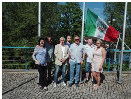
Podniesienie bandery na przystani w Braniewie

goszczeni napojami i jadłem wszelkim, a przedstawiciele Miasta Braniewa i naszej Spółki wspólnie i uroczysto podnieśli banderę.