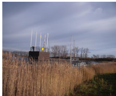
Marina w Błotniku widziana od strony lądu

Podstawowym celem utworzenia porozumienia klastrowego jest zwiększenie szans rozwojowych gospodarki województwa pomorskiego i warmińsko-mazurskiego oraz wzmocnienie konkurencyjności portów, przystani, infrastruktury wodnej śródlądowej i morskiej oraz innych rodzajów infrastruktury turystycznej, sportowej i hydrotechnicznej, leżących na akwenach związanych z działalnością naszej Spółki.