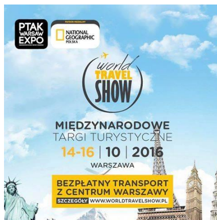
Plakat targów World Travel Show

Jachty, łodzie żaglowe, jachty motorowe, sprzęt motorowodny – skutery, pontony, kajaki. Sprzęt i akcesoria, np. kapoki, pianki, kaski, zegarki itp. silniki, usługi szkutnicze, przyczepy podłodziowe, lawety, szkółki żeglarskie, windsurfing, kite nawigacja / elektronika Targi odbyły się w centrum targowym - PTAK WARSZAW EXPO w Nadarzynie.