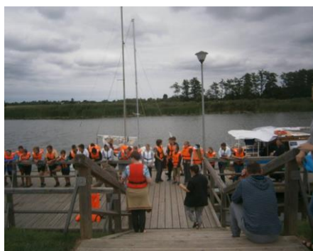
Młodzież w przystani Osłonka

Spółka Pętla Żuławska udostępniła porty i przystanie młodzieży bezpłatnie.