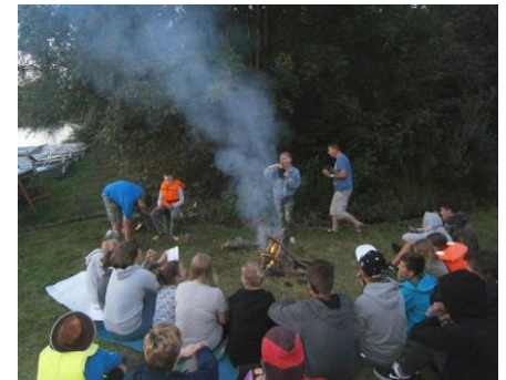
Młodzież odpoczywa wieczorem przy ognisku

pomorskich szkół, z Redy, Pruszcza Gdańskiego, Kosakowa, Gdańska, Gdyni. W pierwszym wakacyjnym rejsie wzięło udział około 40 uczestników, płynących na dziewięciu jachtach żaglowych i motorowych. Rejs rozpoczął się 12 lipca w Gdańsku na przystani Sienna Grobla. Na trasie uczestnicy pokonali śluzy w Przegalinie i Gdańskiej Głowie, zawinęli do Błotnika, Drewnicy, Rybiny, Osłonki, Malborka i Tczewa. Zdarzyły się noclegi "na dziko" na brzegu Wisły ze śpiewaniem szant przy ognisku. Wyjątkowo niekorzystna aura wymusiła przerwanie rejsu na kilka dni, ale to tylko zahartowało młode załogi.