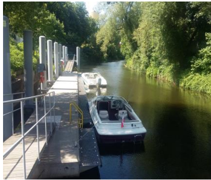
Łodzie motorowe przy przystani w Braniewie

Na stronie znajdziecie Państwo także całoroczny kalendarz imprez na i wokół Pętli Żuławskiej. Zachęcamy także do obejrzenia kilkunastu filmów o Pętli Żuławskiej.