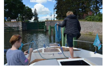
Żeńska załoga Radia Gdańsk na trasie

Białej Góry. Na koniec rejsu właściciel łódki ufundował dla słuchaczy Radia Gdańsk darmowy weekend na hausboicie.