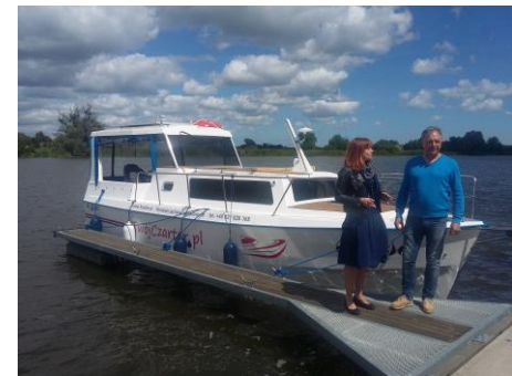
Dziennikarka TVP Gdańsk i właściciel firmy „Twój czarter” podczas kręcenia filmu.

Wspólnie z Gminą Nowy Dwór Gdański uczestniczyliśmy w programie na żywo TVP Gdańsk pt. Pomorskie na weekend, gdzie jako jedna z głównych atrakcji regionu Żuław pokazywano Obszar pętli Żuławskiej. Zależało nam głównie na przybliżeniu mieszkańcom Pomorza możliwości pływania barką mieszkalną lub łódką żaglową bez uprawnień. Dziękujemy naszym operatorom w Rybinie i Malborku za pomoc w kręceniu niektórych scen na wodzie oraz firmie „Twój czarter” za udostępnienie łódki do nakręcenia filmu.