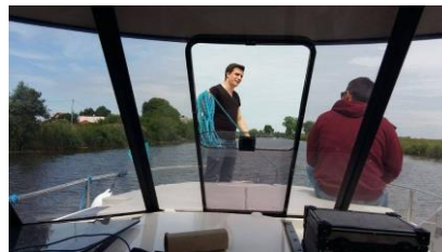
Radio Gdańsk na Pętli Żuławskiej