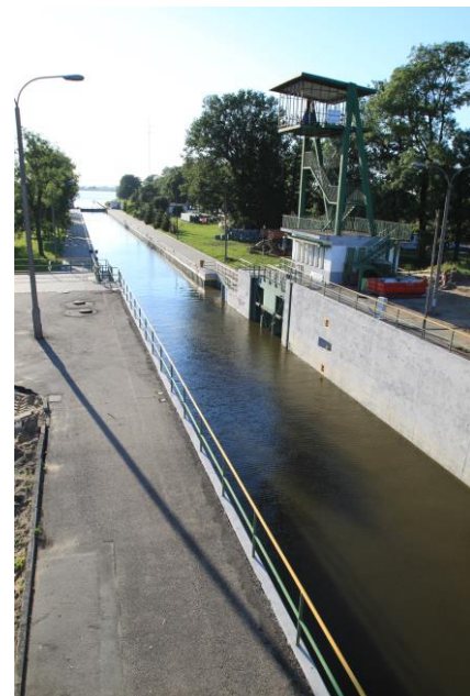
Śluza w Przegalinie

Będziemy naciskać na władze RZGW, aby przesunąć rozpoczęcie remontu na jesień 2017 roku. W innym przypadku zarówno Spółka Pętla Żuławska jak i właściciele infrastruktury wodniackiej, a w tym gminy, poniosą znaczne straty finansowe.