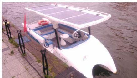
Motorówka solarna w Gdańsku