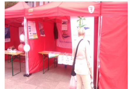
Pętla Żuławska na Targu Rybnym w Gdańsku.