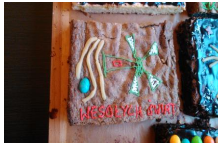
Świąteczny mazurek upieczony z logo Pętli Żuławskiej