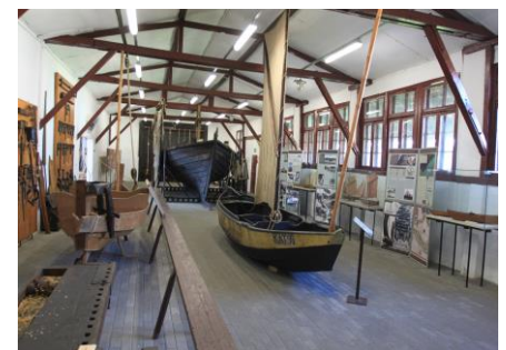
Muzeum Zalewu Wiślanego w Katach Rybackich

W dniu 18 grudnia Lider projektu Marriage II (wymiana doświadczeń i wspólna promocja południowego wybrzeża Bałtyku) złożył także w imieniu Spółki Pętla Żuławska aplikację do program INTERREG South Baltic Programme. Partnerami w projekcie będą: Meklemburgia Pomorze Przednie / DE, Zachodniopomorskie & Pomorskie / PL, Kaliningrad / RU, Kłajpeda / LT), Bornholm / D. Planowany budżet projektu dla Pętli Żuławskiej wynosić będzie ok. 100.000 euro w okresie 3 lat realizacji, przy wkładzie własnym 15%. Rozstrzygnięcie konkursu planowane jest w kwietniu 2016 roku.