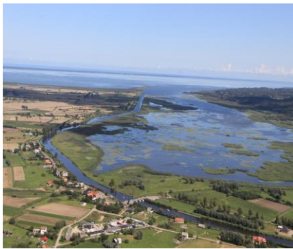
Widok na Zatokę Elbląską