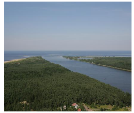
Przekop Wisły (data budowy 1895 r.)