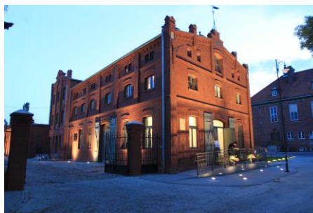
Żuławski Park Historyczny w Nowym Dworze Gdańskim

W dniu 9 grudnia 2015 roku w Żuławskim Parku Historycznym w Nowym Dworze Gdańskim odbyła się konferencja poświęcona finalizacji przez Województwo Pomorskie prac studialnych dla przedsięwzięcia strategicznego „Rozwój oferty turystyki wodnej w obszarze Pętli Żuławskiej i Zatoki Gdańskiej”.