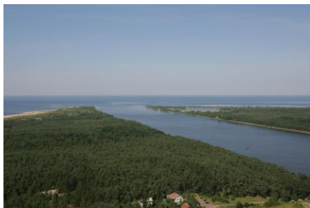
Przekop Wisły z lotu ptaka

Straty po powodziach i strach przed kolejnymi zacydowały o uregulowaniu Wisły i stworzeniu jej nowego ujścia. Nowe koryto powstawało w latach 1890–1895 na odcinku od Kieźmarka do Zatoki Gdańskiej. Przy budowie pracowało, dzień w dzień, tysiąc ludzi i 40 maszyn parowych. Kanał o długości 7 km i szerokości od 250 do 400 m otoczono wysokimi na 10 m wałami. 31 marca 1895 roku, na telegraficzny sygnał cesarza, prezydent Prus Zachodnich otworzył drogę pierwszym strugom wiślanym. Przekop skrócił Wisłę o 10 km.