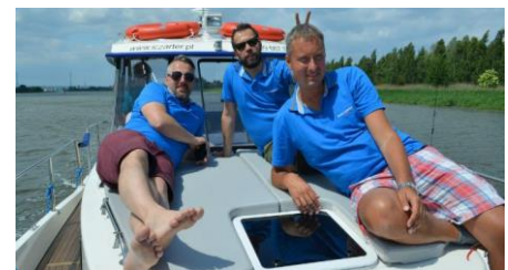
Dziennikarze Radia Gdańsk na trasie Pętli Żuławskiej.

Radiu Gdańsk dziękujemy za świetną promocję naszego szlaku wodnego !!!!