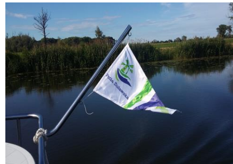
Bandera Pętli Żuławskiej na Szkarprawie.

Na Zalewie Wiślanym od 2007 r. niekomercyjne jachty morskie zwolnione są z obowiązku posiadania Kart Bezpieczeństwa, a co za tym idzie WWR i innych dokumentów. Po wodach Zalewu Wiślanego można w zasadzie żeglować każdym śródlądowym jachtem żaglowym. Zgodnie z nowymi przepisami wystarczy osoba z patentem żeglarza jachtowego.