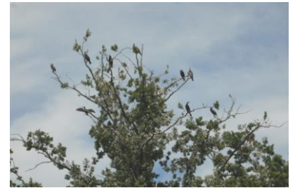
Kormorany na rzece Nogat.

RADIO GDAŃSK wyruszyło ponownie na objazd Pętli Żuławskiej. Rejs odbywał się w dniach 14 – 19 czerwca. Hauseboot'a otrzymaliśmy dzięki uprzejmości firmy I" CZARTER z Żuławek . Rejs odbywał się w tym roku Szarpawą na Zalew Wiślany do Katów Rybackich . Następnie po Zalewie Wiślanym do Suchacza i dalej Nogatem przez Malbork, Białą Górę na Wisłę . Po raz pierwszy dziennikarze postanowili popłynąć w górę rzeki i dotarli do mostu na Wisłę na wysokości Kwidzyna oraz do Korzeniewa .